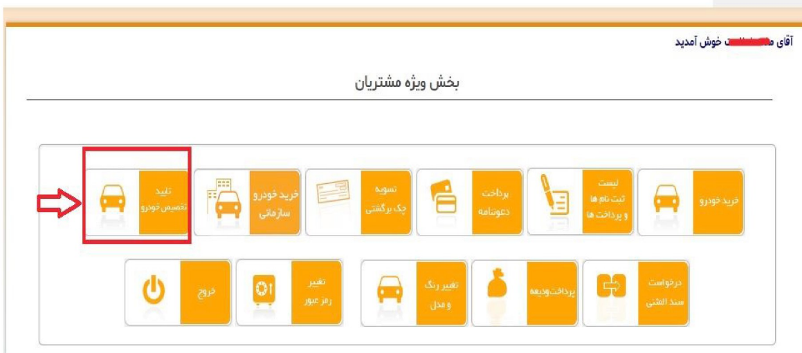
تصویر شماره 4- نمایی از صفحه بخش ویژه مشتریان