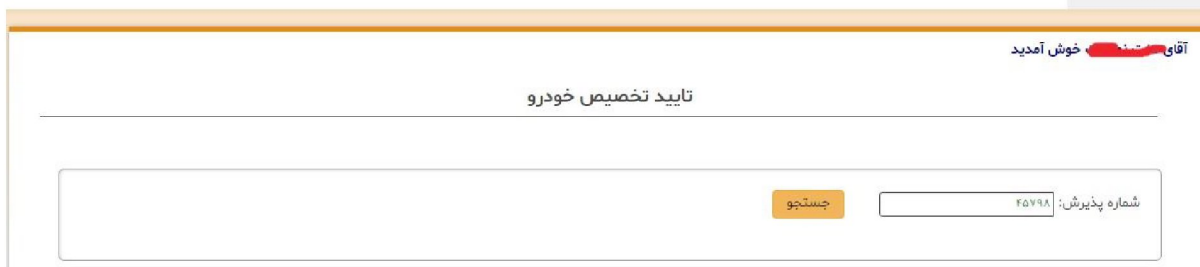
تصویر شماره 5- نمایی از صفحه تایید تخصیص خودرو - دریافت شماره پذیرش