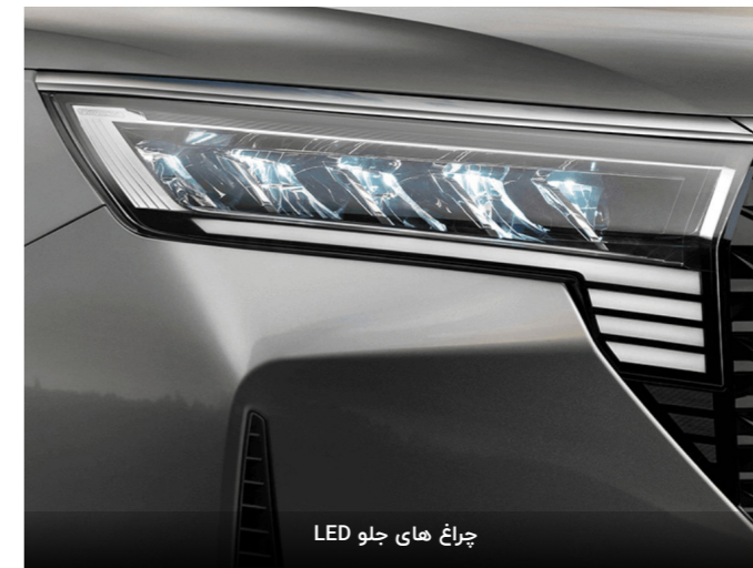
چراغ های جلو LED