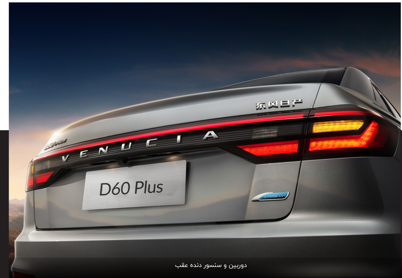
دوربین و سنسور دنده عقب