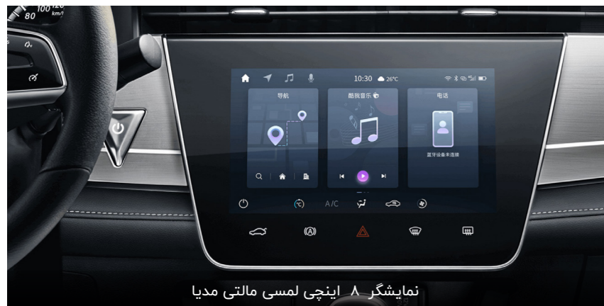
نمایشگر ۸ اینچی لمسی مالتی مدیا