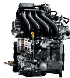
موتور ۱/۶ لیتر تنفس طبیعی نیسان