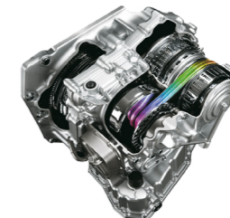
گیربکس XTRONIC CVT نیسان