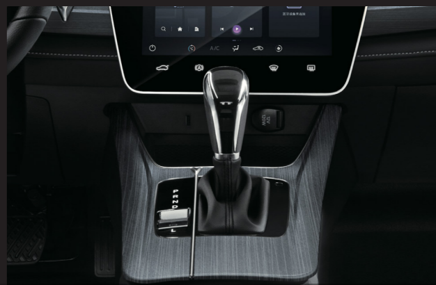
ترمز پارک برقی