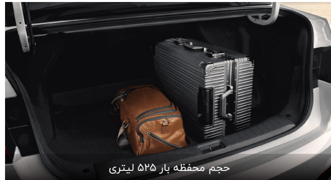
حجم محفظه بار ۵۲۵ لیتری