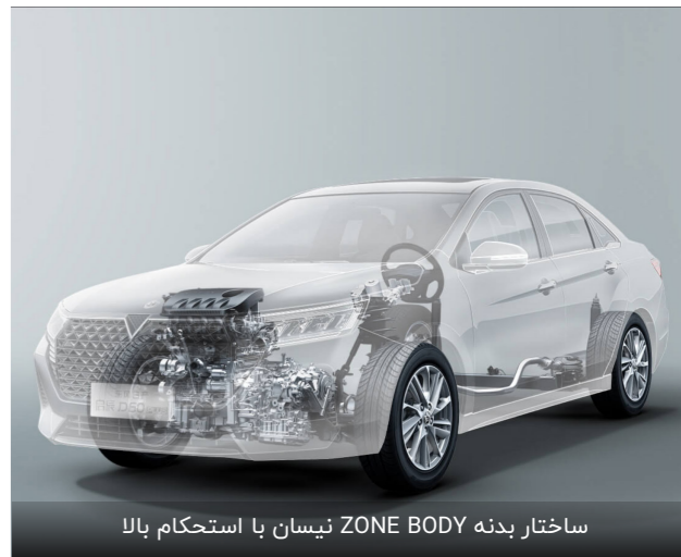
ساختار بدنه ZONE BODY نیسان با استحکام بالا