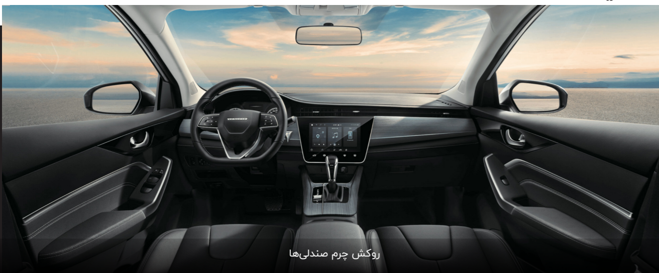
روکش چرم صندلی‌ها