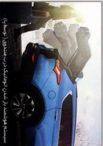
سیستم هوشمند باز شدن اتوماتیک درب مصدنی (توسط پا)