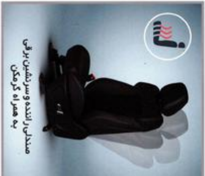
مصدنی راننده و سر نشین برقی به همراه گرمکن