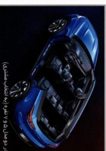
در دو مدل ۷ و ۵ نفره (به انتخاب مشتری)