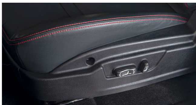
صندلی راننده با تنظیم برقی در ۶ جهت