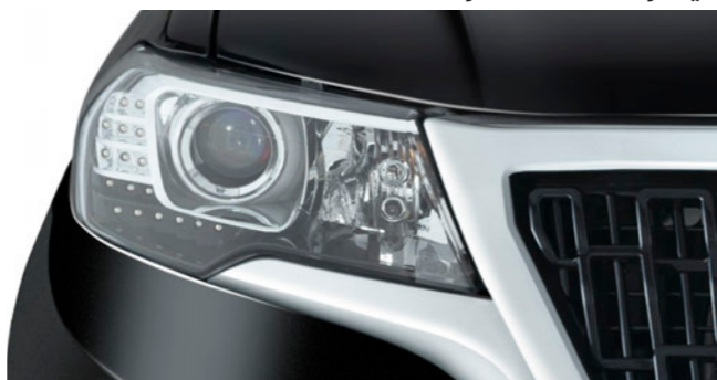
چراغ‌های جلو هالوژن