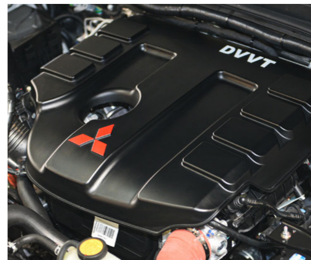
موتور ۲/۴ لیتر توربوشارژر میتسوبیشی