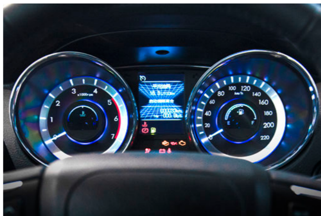
نمایشگر TFT اطلاعات سفر