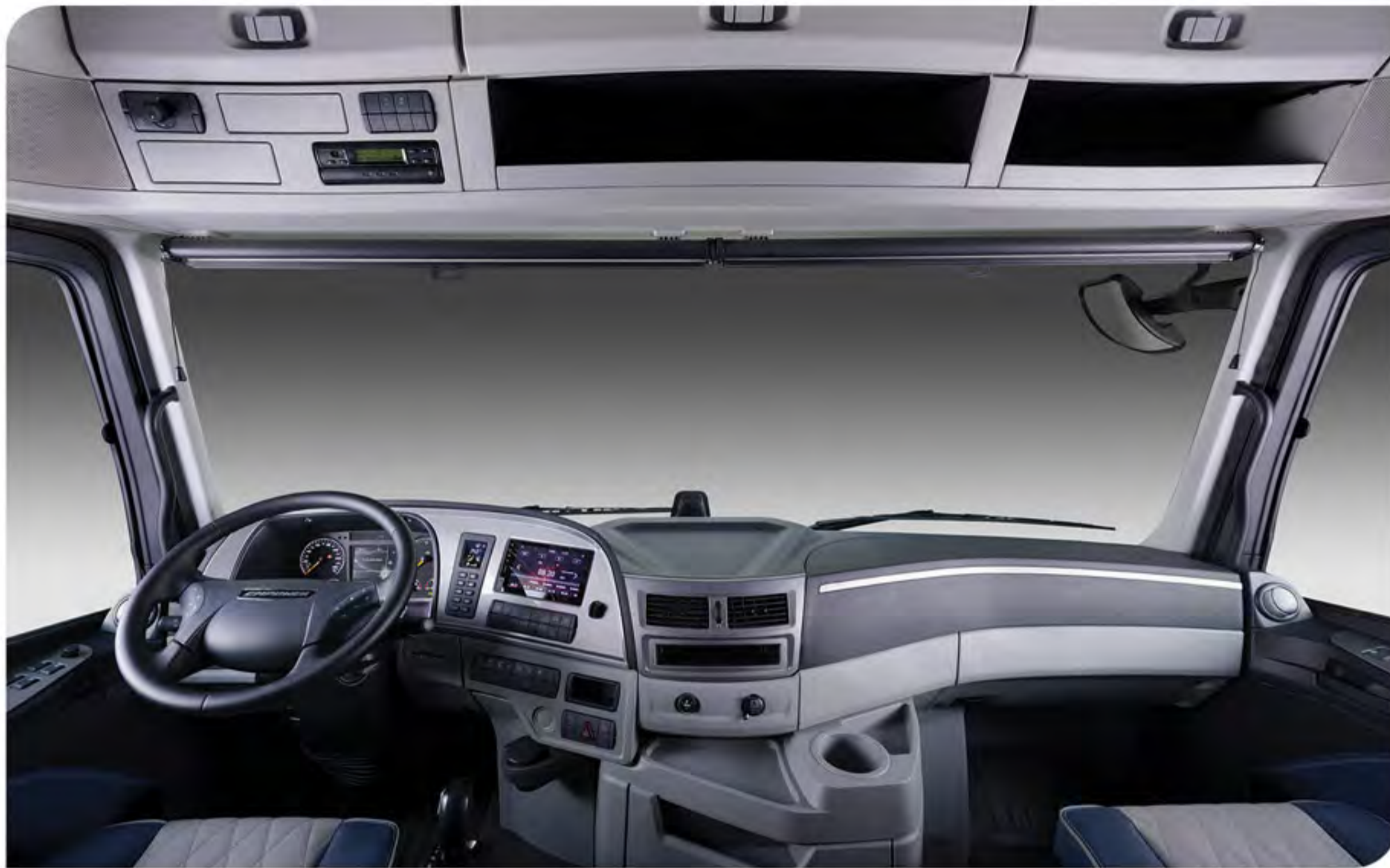
- کابین ارگونومیک و مدرن