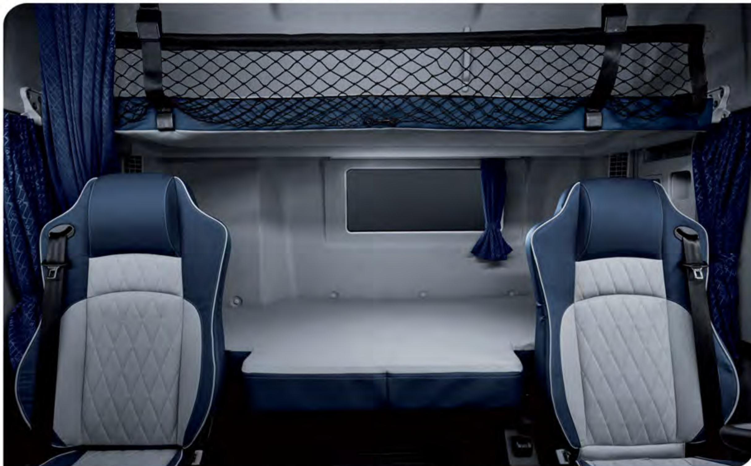
- دارای دو تخت خواب بزرگ جهت استراحت راننده و سرنشین