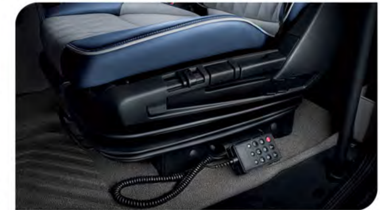
- صندلی راننده با سیستم تعلیق بادی و قابلیت تنظیم در ۶ جهت