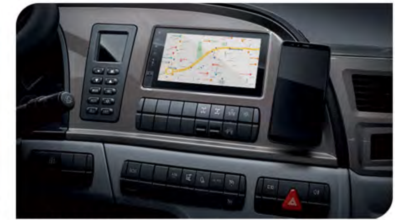
- مولتی مدیا TFT لمسی (رادیو، رهیاب، بلوتوث، USB، SD)