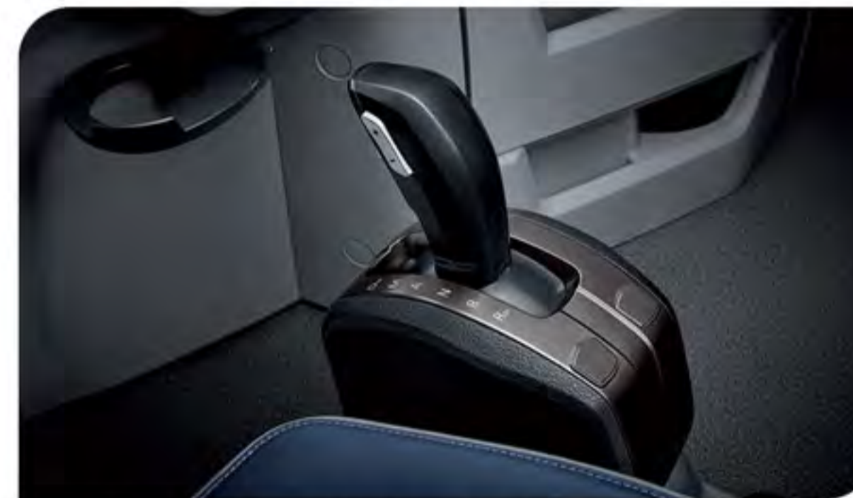
- دسته دنده مدرن (تعویض دنده اتوماتیک و دستی)