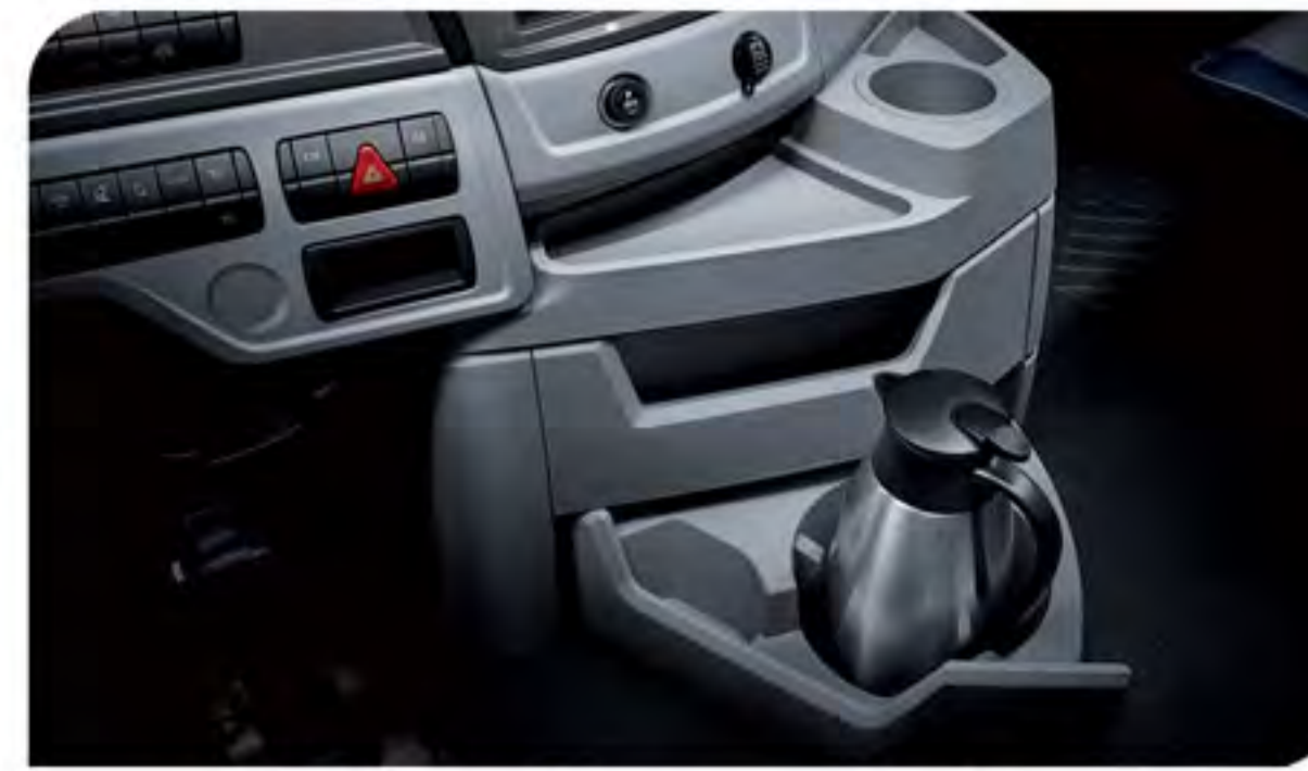
- محفظه های متعدد جهت نگهداری وسایل