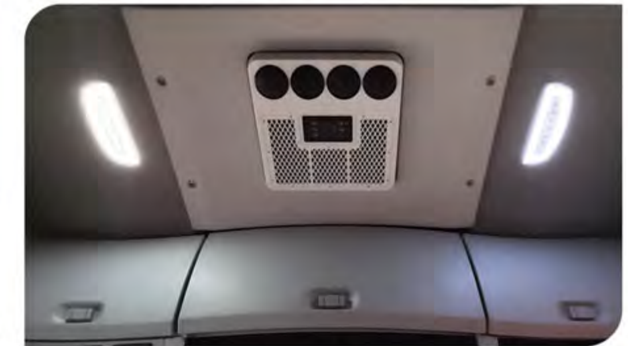
- کولر درجا