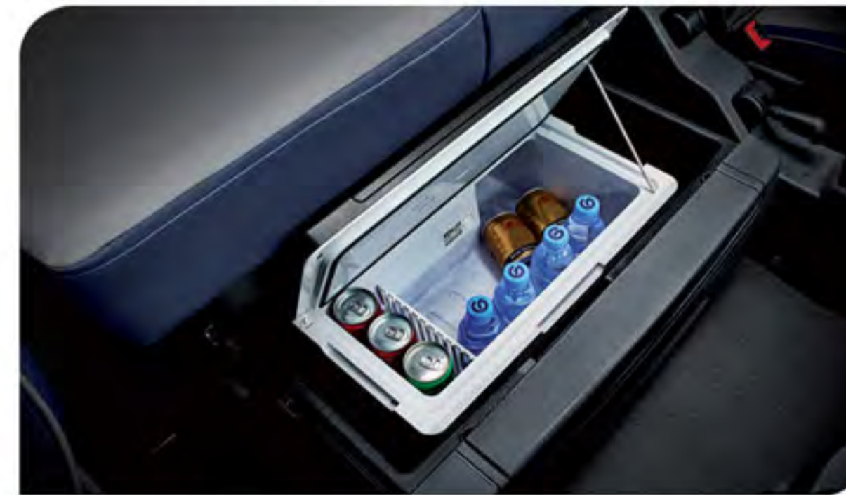
- مجهز به یخچال مسافرتی در زیر تخت