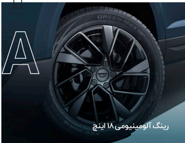
رینگ آلومینیومی ۱۸ اینچ