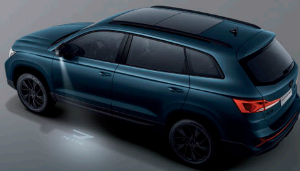
چراغ خوش آمدگویی