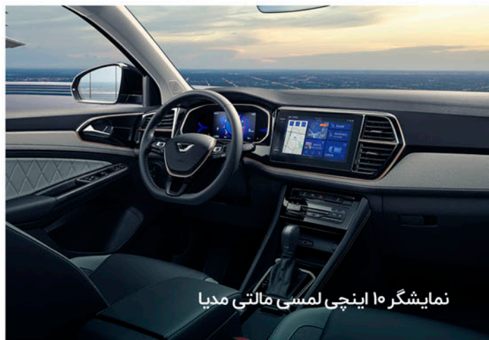
نمایشگر ۱۰ اینچی لمسی مالتی مدیا