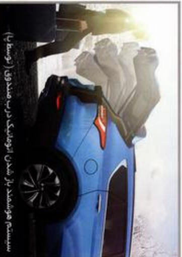
سیستم هوشمند باز شدن اتوماتیک درب مصدنی (توسط پا)