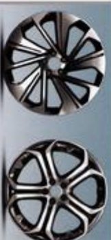
مدل: AR20-11 مدل: AR20-12 رینگ آلومینیومی ۲۰ اینچ (به انتخاب مشتری)