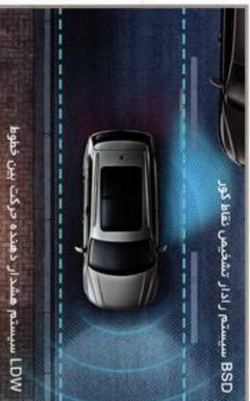
سیستم رانندگی تطبیقی نقطه کور