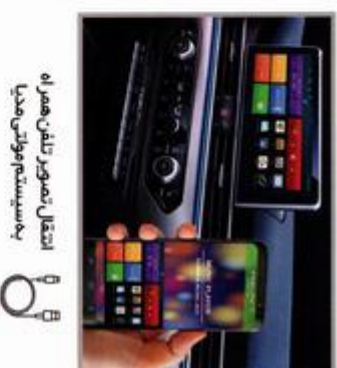
اتصال تصویر تلن همراه به سیستم صوتی مدیا