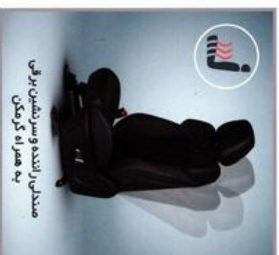
مصدنی راننده و سر نشین برقی به همراه گرمکن