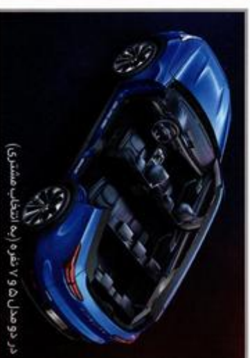
در دو مدل ۷ و ۵ نفره (به انتخاب مشتری)