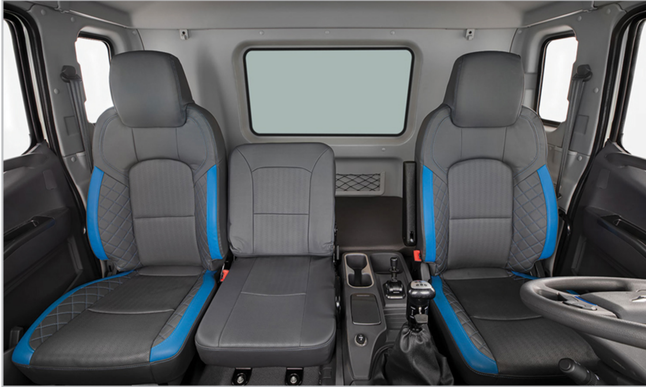
تخت خواب بزرگ و صندلی میانی