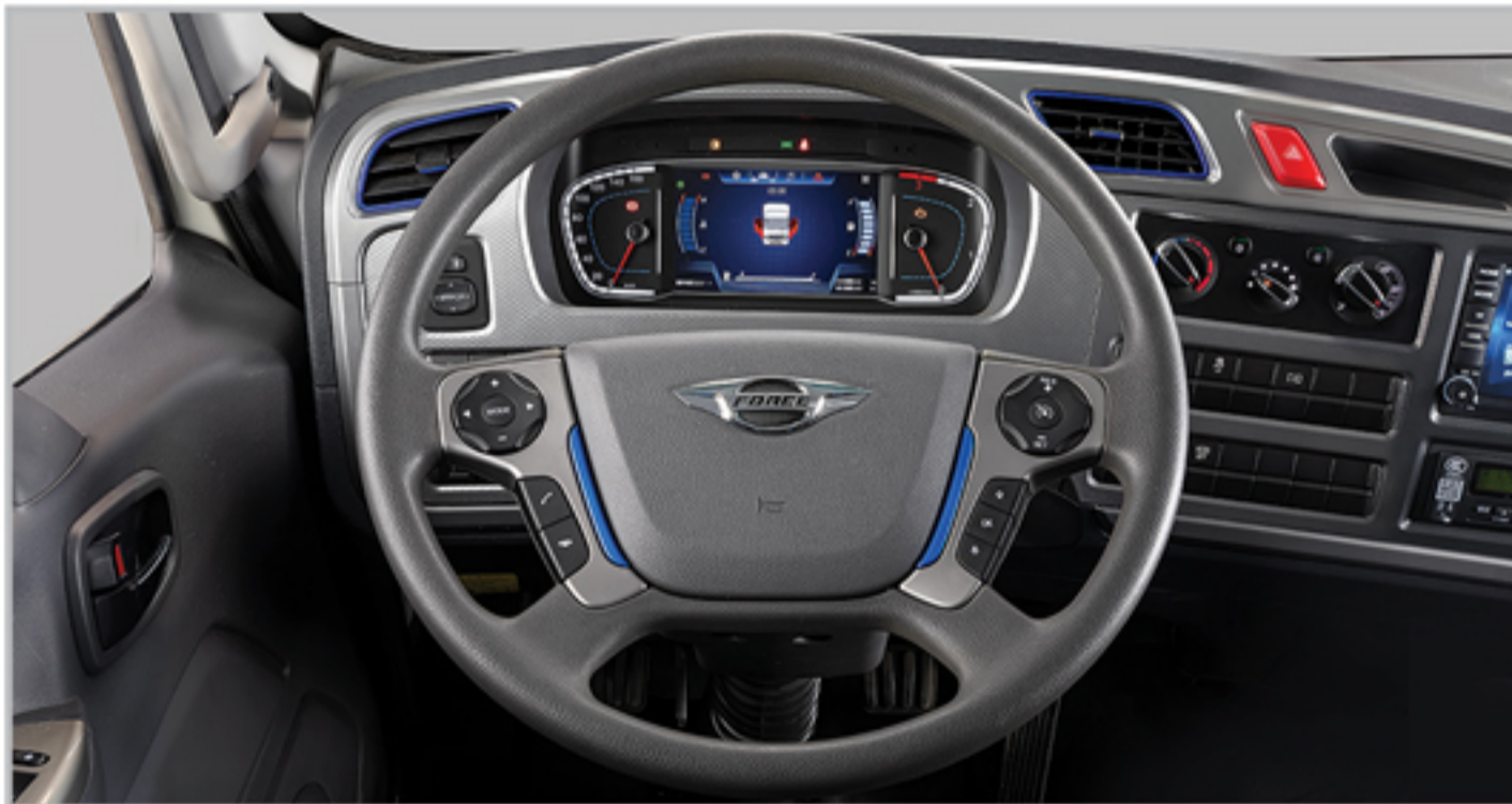
غریبک فرمان مجهز به کلیدهای دسترسی به مولتی مدیا و کروز کنترل