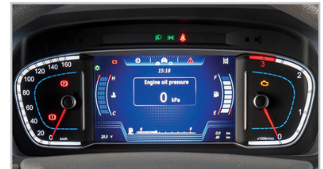
جلو آمپر دیجیتال با قابلیت عیب یابی خودرو