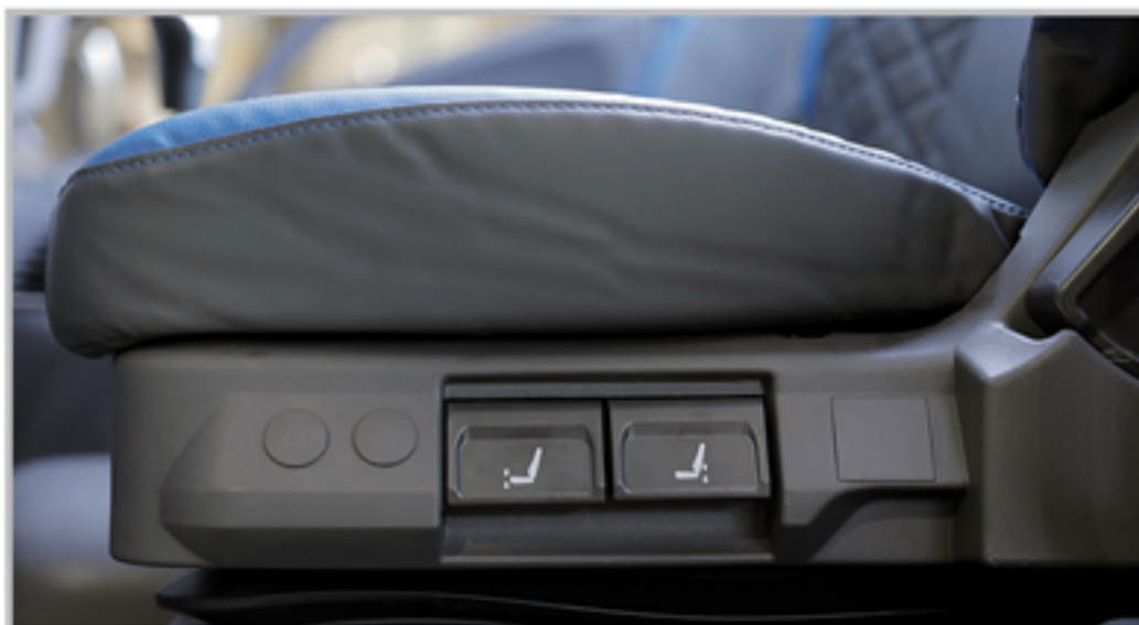
صندلی پنوماتیک راننده با قابلیت تنظیم در ۶ جهت