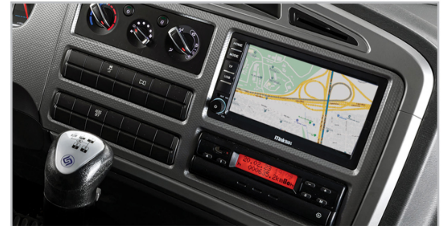
مولتی مدیا TFT لمسی (رادیو، رهیاب، بلوتوث، SD، USB)