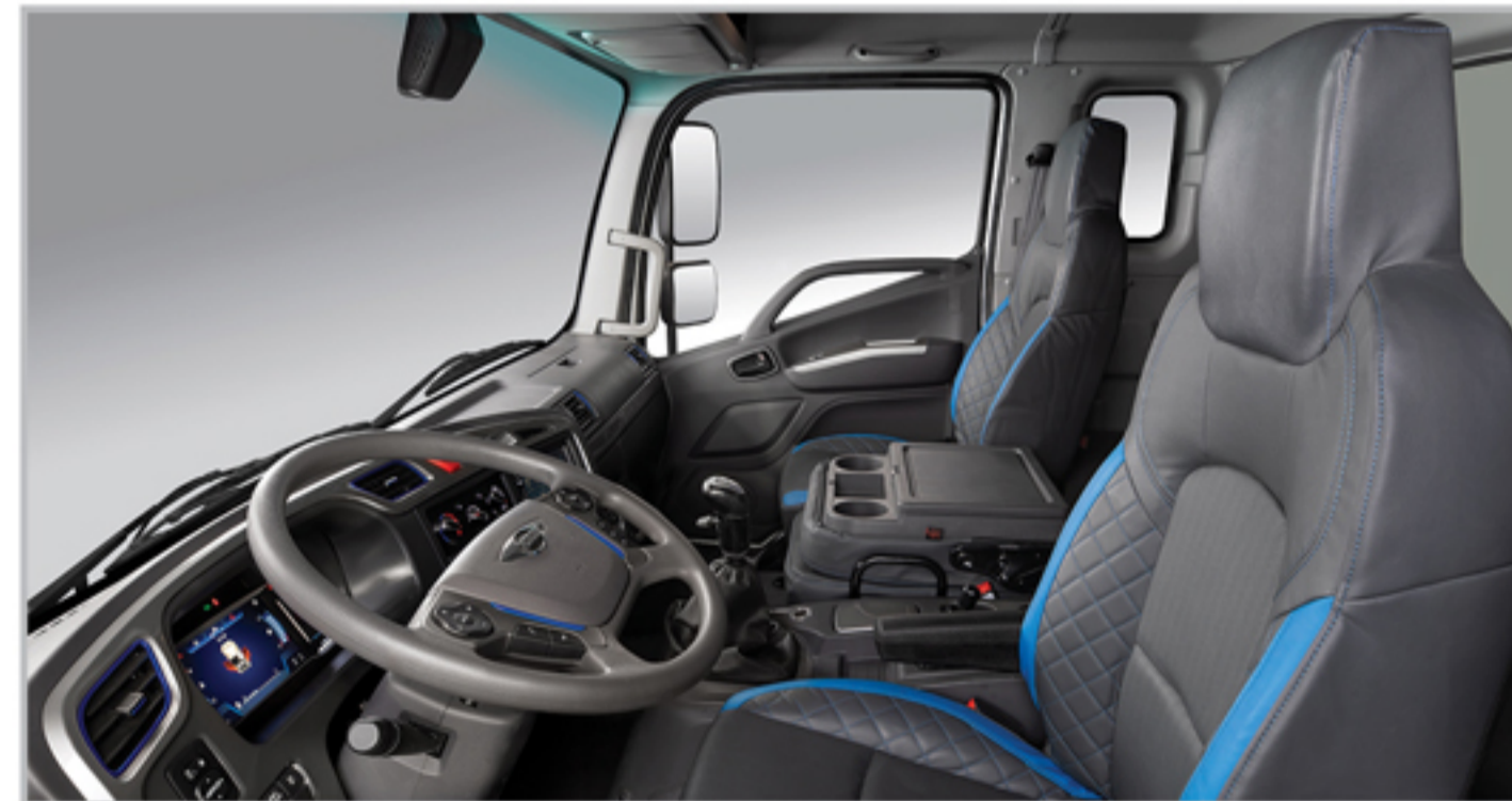
قابلیت تبدیل صندلی میانی به کنسول و جا لیوانی