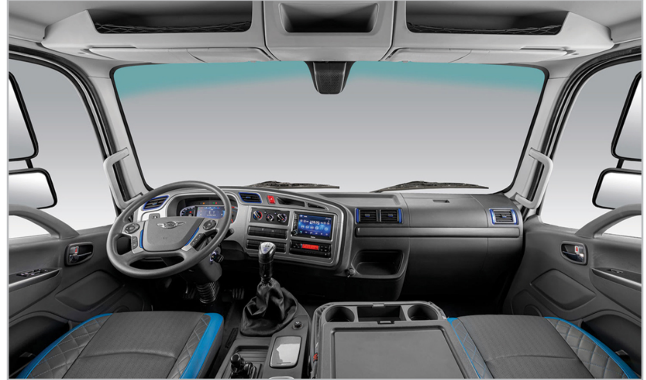
کابین بزرگ، ارگونومیک و مدرن